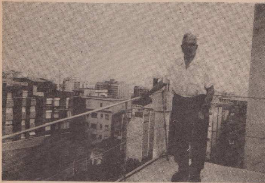
La magnífica panorámica que se divisa desde el palomar: Toda Barcelona